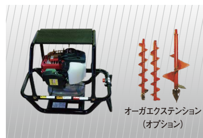
オーガエクステンション (オプション)

※記載されている機種は当社保有の代表的な機種であり、仕様は型式・年式等により異なる場合があります。また予告なく変更する場合があります。※地域によって取扱いの異なる場合や取扱いのない商品があります。※本カタログで提供している各種情報につきましては正確な情報を掲載するよう注意を払っておりますが、当該情報に基づいて起こされた行動によって生じた損害に対してはいかなる責任も負いません。